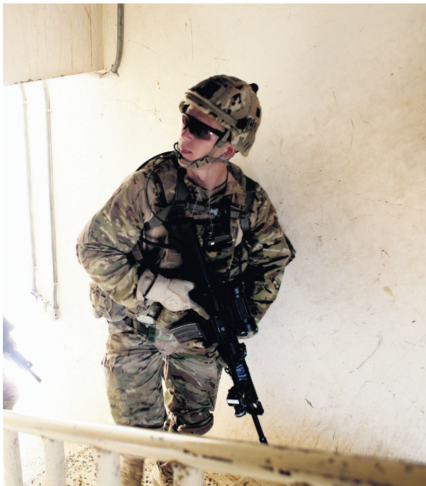
Danske soldater i Helmand i færd med at undersøge en bygning. Det er ofte yderst sparsomt, hvad Forsvaret har fortalt, når civile afghanere er blevet dræbt af danskere. Information genfortæller her en sag, hvor flere familiemedlemmer døde efter et dansk morterangreb mod en gård.

in the sky, men vi kan ikke se, hvem der befinder sig inde i bygningerne.»